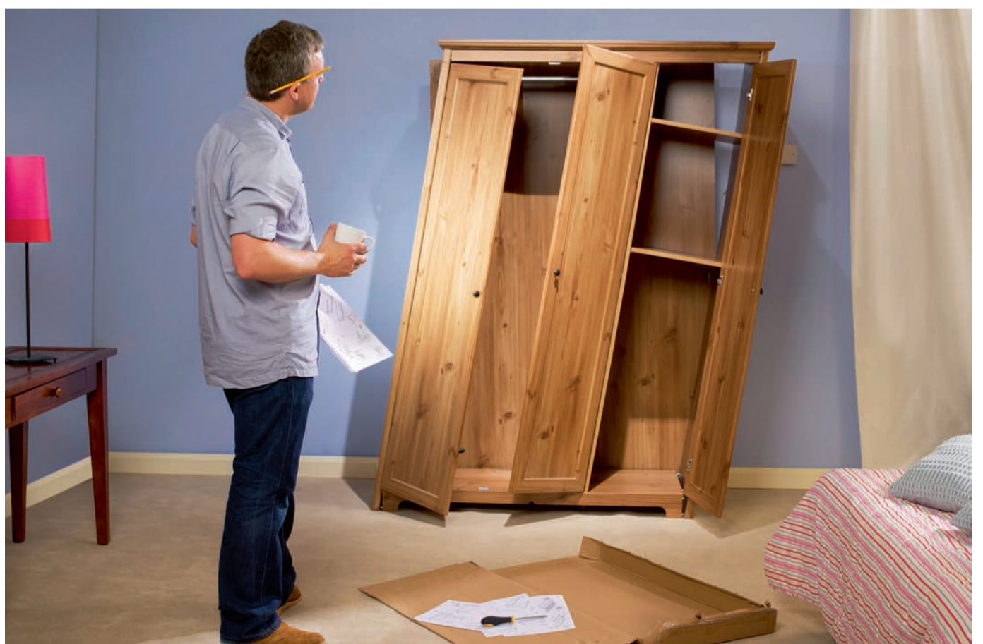
De regering inspecteerde het geleverde werk en zei "dat het goed was."