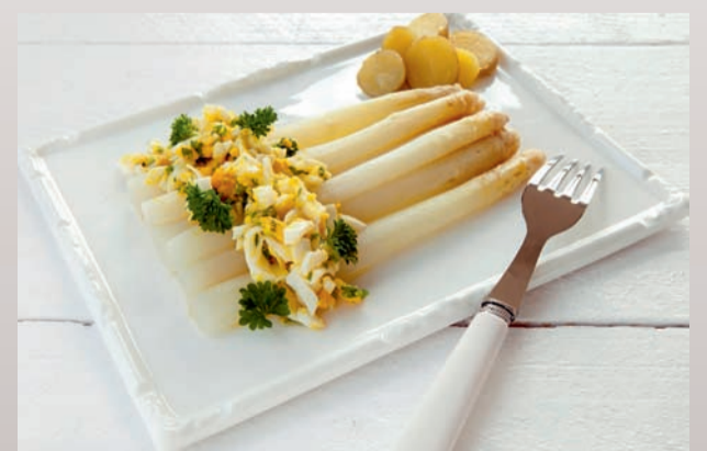
■ Asperges op Vlaamse wijze, Linx+ Tongeren 23 mei

met een gids verkennen we de lavendelvelden en krijgen we een woordje uitleg over alle facetten van lavendel: soorten, verzorging, toepassingen en het distilleren. Daarna genieten we van een heerlijk lavendelborreltje. Afspraak om 13.15 uur op de parking van de Limburghal in Genk of om 14 uur ter plaatse: Olmenbosstraat 25, Stokrooie-Hasselt. Einde om 15.30 uur. Inschrijven vóór 19 mei. Prijs: €5 per persoon. Voor meer info over en inschrijvingen voor activiteiten van Carpe Diem kan je mailen naar wasil.tokarek@gmail.com of bellen naar 011 52 35 36 (liefst na 18 uur).