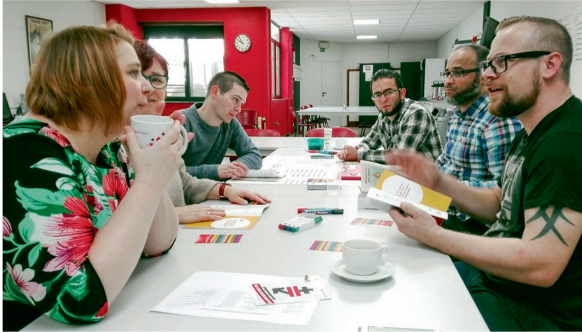
■ Delegees werken samen rond het thema 'werkbaar werk'

De helft van de werknemers in Vlaanderen heeft geen werkbaar werk. Samen met delegees, militanten en secretarissen ondersteunen wij syndicale werkingen op de bedrijfsvloer om werk te maken van werkbaar jobs en gelijke kansen, en daarnaast ook discriminatie en uitsluiting een halt toe te roepen.